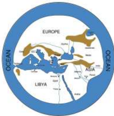
Το σύμπαν του Αναξίμανδρου μια χειμερινή νύχτα